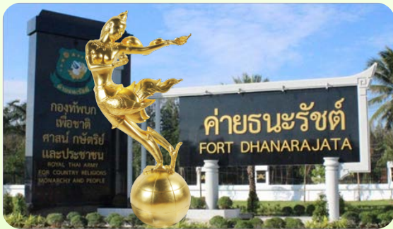
Thailand Tourism Awards 2002