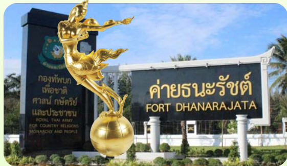
Thailand Tourism Awards 2002