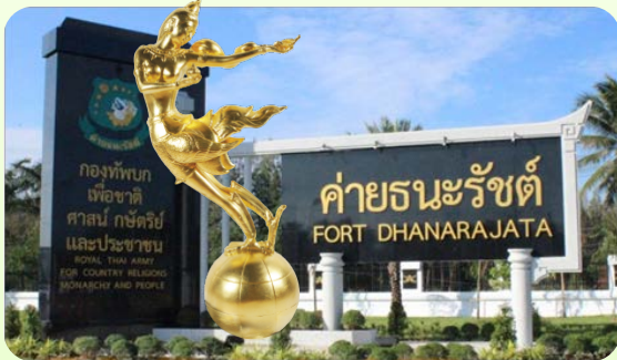
Thailand Tourism Awards 2002