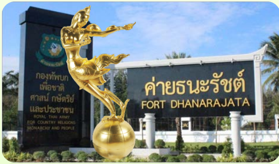
Thailand Tourism Awards 2002